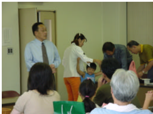
八木社会奉仕委員長の司会進行