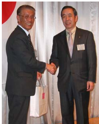
大野様と渋谷会長