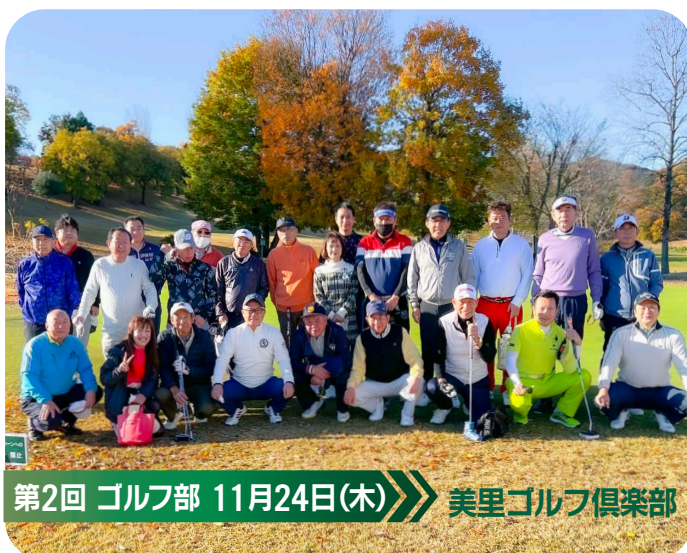
第2回 ゴルフ部 11月24日(木) 美里ゴルフ倶楽部

あと3年2か月弱でシニアになりますが、体の健康のためにも、今後もゴルフを楽しんでまいりたいと思います。ありがとうございました。