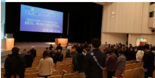
被災者の方々に黙祷