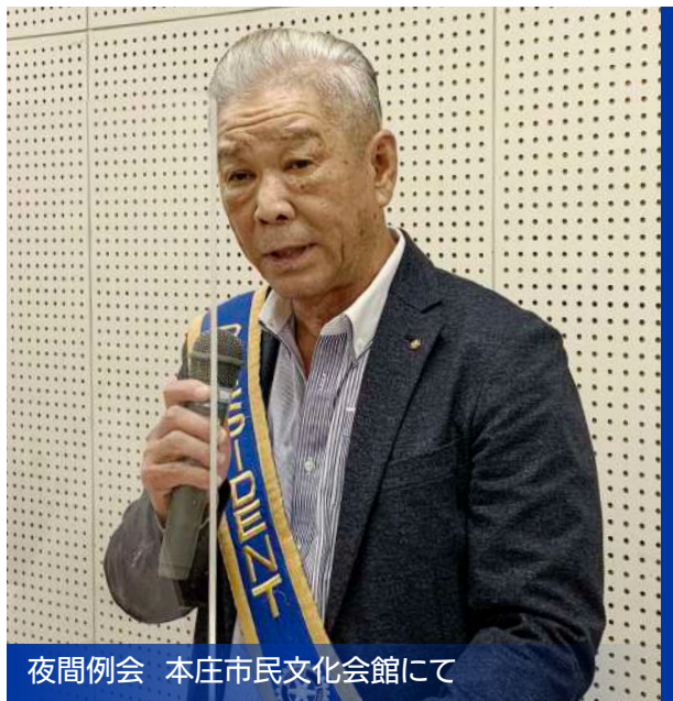
夜間例会 本庄市民文化会館にて