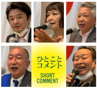
ひとこと SHORT COMMENT