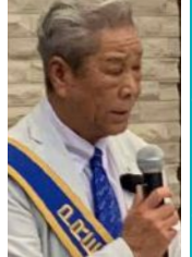
Thank you for a year