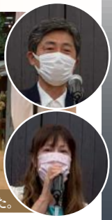
本日60名参加していただきました。ありがとうございました。