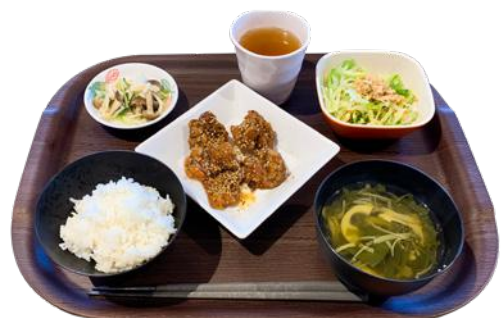
本日の昼食 『(株)ウラノ様の社食にて』